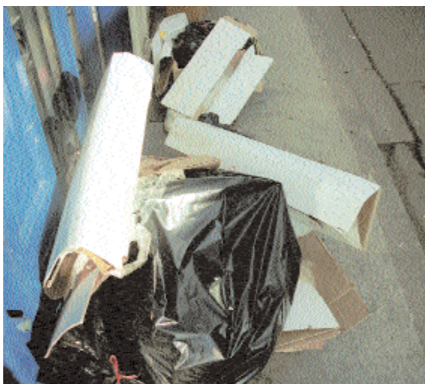
Application des mesures d'hygiène

Depuis des décennies, de nombreux Brivistes en franchissent la porte pour se faire vacciner ou pour mettre à jour un rappel. Et cette vocation du service n'a pas failli puisque le mercredi, un médecin assure les séances de vaccinations obligatoires telles que tuberculose, diphtérie, tétanos, poliomyélite et recommandées comme oreillons, rubéole, rougeole, etc. Un médecin diplômé en médecine tropicale propose également des consultations et des conseils pour les voyageurs et la possibilité de faire sur place les vaccinations internationales (fièvre jaune, etc) nécessaires pour aller dans certains pays. Les séances se déroulent tous le mercredi pour les vaccins tra-