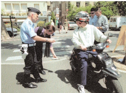
Contrôle du bruit et de la pollution