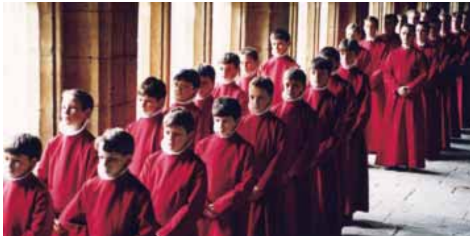
Le New College d'Oxford, un chœur d'enfants aux voix exceptionnelles.

Vendredi 25 juillet → Depuis 27 ans, le Festival de la Vézère rayonne dans tout le Pays de Brive et même au-delà. Vingt-sept ans au service de la musique classique comme ce concert exceptionnel qui donnera le chœur d'enfants du New Collège d'Oxford. Fort d'une tradition longue de plus de 600 ans, le Chœur du New College, trente voix d'enfants exceptionnelles, est l'un des meilleurs ensembles vocaux du Royaume-Uni. Plus qu'une chorale amateur, ce chœur s'apparente au grand chœur professionnel grâce au travail assidu, à la volonté et à l'enthousiasme des enfants. Au programme de ce récital qui donnera le New College d'Oxford, de la musique anglaise dont celle d'Henry Purcell, Gregorio Allegri, Antonio Lotti et des compositeurs contemporains comme James Mac Millan, Francis Poulenc, Olivier Messiaen et Henryk Gorecki. Direction : Edward Higginbottom.