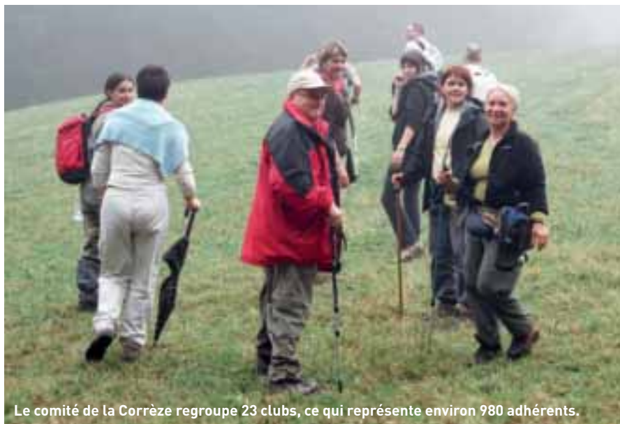
Le comité de la Corrèze regroupe 23 clubs, ce qui représente environ 980 adhérents.

A.V. : La Fédération compte aujourd'hui 200.000 licenciés, mais d'autres fédérations proposent aussi la marche dans leurs activités. D'après une étude qu'elle a commandée, on estime en France qu'il y a entre 15 et 18 millions de marcheurs occasionnels, soit des gens qui se baladent en famille, comme ici, par exemple, autour du lac du Causse soit des gens qui empruntent les circuits balisés pour éviter de se perdre.