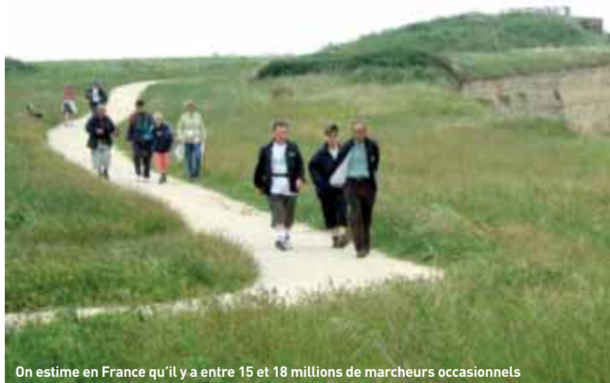
On estime en France qu'il y a entre 15 et 18 millions de marcheurs occasionnels

A.V. : Ils sont une soixantaine pour l'ensemble de la Corrèze qui se répartissent des parties de GRP et de GR soit 1132km. A Brive, nous en avons par exemple trois au sein des Rando-gaillardes qui ont chacun en charge des tronçons entre Uzerche et Jugeals-Nazareth. Il existe un autre club Atout sentiers, qui a été créé spécialement pour former des baliseurs et qui en compte 6. Les autres clubs propo-