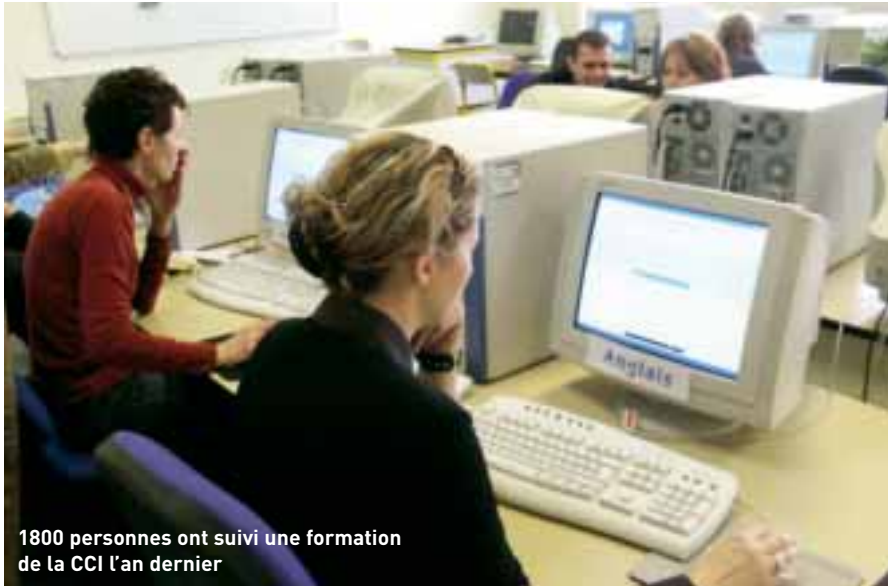
1800 personnes ont suivi une formation de la CCI l'an dernier

L a CCI déploie une large palette de formations pour tous publics, professionnels, étudiants et particuliers. A découvrir les 14 et 15 mars lors des journées portes ouvertes.