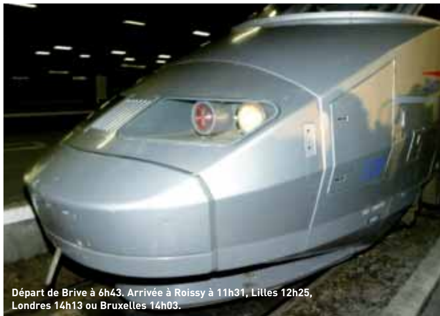
Départ de Brive à 6h43. Arrivée à Roissy à 11h31, Lille 12h25, Londres 14h13 ou Bruxelles 14h03.

A compter du 9 décembre, une liaison grande vitesse permettra de relier Brive à Lille via l'aéroport de Roissy. De là, les voyageurs pourront prendre l'Eurostar ou le Thalys pour Londres et Bruxelles.