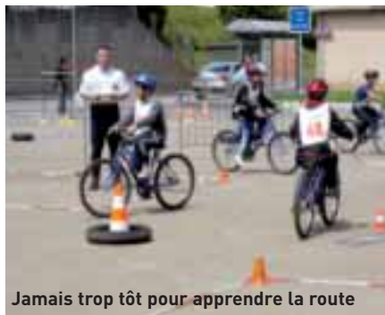
Jamais trop tôt pour apprendre la route

Pour la Prévention routière, l'éducation des jeunes est une priorité. Dans ce cadre, le comité corrézien a mis une piste d'éducation routière à disposition de toutes les écoles. Piste animée en partenariat avec des policiers et des