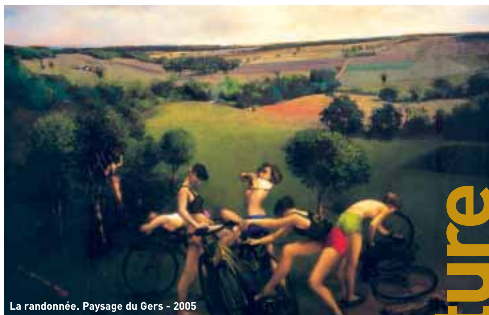
La randonnée. Paysage du Gers - 2005

Femme → Cette exposition de Jean-Pierre Le Bozec présente 32 pastels qu'il a réalisés depuis 1990. Portraits, natures mortes, scènes de gynécée suivies de paysages habités de jeunes filles en liberté, l'ensemble des œuvres de cet artiste donne à goûter les subtilités de la lumière, une lumière apaisante née d'un « déshabillage successif ».