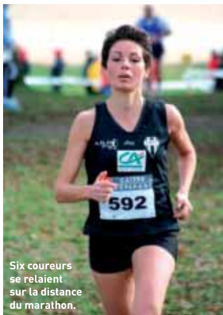
Six coureurs se relaient sur la distance du marathon.