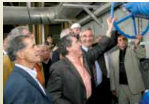
Les élus de la CAB ont ouvert les vannes de la nouvelle station d'épuration

La station d'épuration fonctionne et les travaux de finition se poursuivent. L'inauguration est prévue pour l'automne