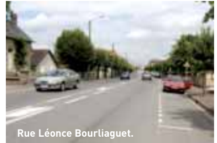
Rue Léonce Bourliaguet.

A l'instar de la rue Pierre Chaumeil à Tujac, la Ville, après concertation avec les riverains, va tester pendant quelques mois des travaux de mise en sécurité de la rue Léonce Bourliaguet à Bouquet et de l'avenue du 18 juin 1940 à Tujac. Ce n'est qu'à l'issue de cette période d'expérimentation et si le test a été concluant, que les travaux définitifs seront réalisés avec des aménagements en dur.