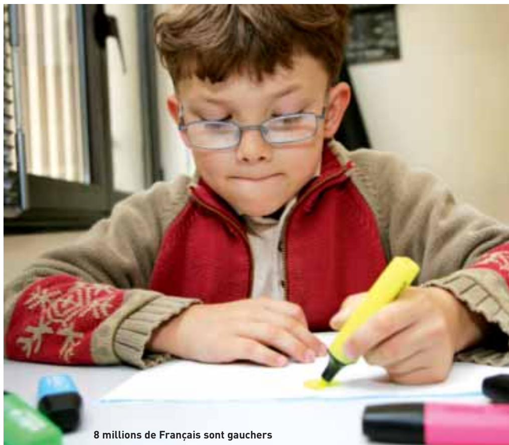
8 millions de Français sont gauchers

De nos jours, même si les « gauchers contrariés » tendent à disparaître, l'apprentissage de l'écriture n'est pas toujours aisée pour un enfant gaucher, la main masquant les lettres fraîchement tracées. Plus tard, il lui faudra apprendre à se servir de ciseaux, d'un taille-crayon, d'une règle, tous ces objets du quotidien de l'enfance conçus pour les droitiers. A l'âge adulte, ce sera l'ouvre-boîte, le tire-bouchon mais aussi le sécateur, les couteaux... Les objets de notre société sont créés pour les droitiers reléguant les gauchers au rang de minorité. Pourtant... 13% de la population, soit 8