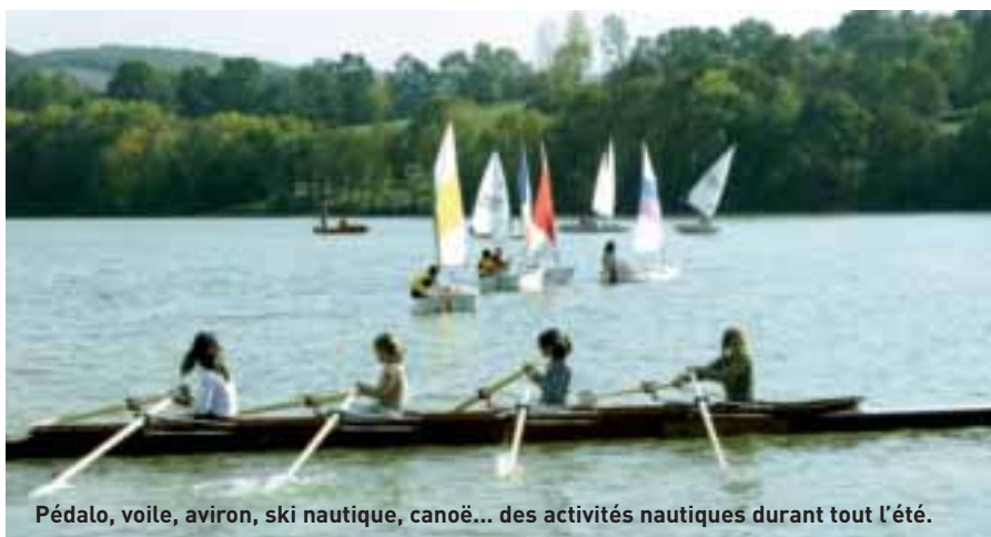
Pédalo, voile, aviron, ski nautique, canoë... des activités nautiques durant tout l'été.

Les algues ont donc été retirées et un cabinet spécialisé a mené une étude pour éviter que le problème ne se reproduise. « Nous allons nous montrer très vigilants en nous appuyant sur ce rapport. » Celui-ci préconise une vidange partielle d'un mètre tous les deux ans et que chacun respecte mieux l'environnement. « Le causse c'est du gruyère. Le calcaire est perméable, tout passe dans les rivières souterraines et finit dans le lac, avec les