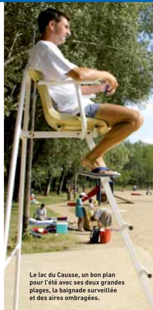
Le lac du Causse, un bon plan pour l'été avec ses deux grandes plages, la baignade surveillée et des aires ombragées.

Cette année, le lac a donc entamé sa saison estivale sous les meilleurs auspices. Il doit cette transparence inédite à sa récente vidange totale. Si les travaux imprévus de colmatage d'une fissure sur la digue ont