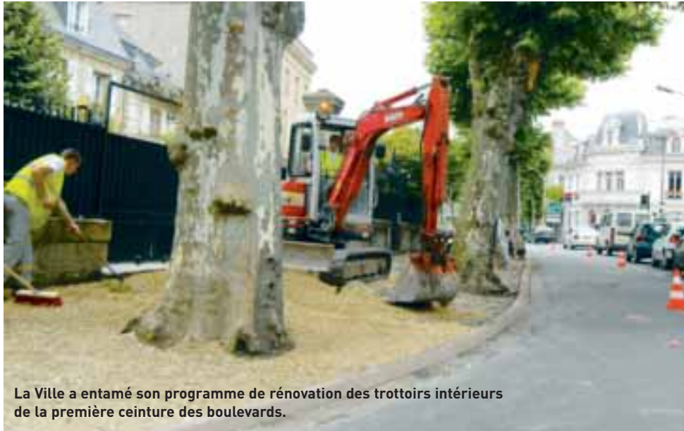
La Ville a entamé son programme de rénovation des trottoirs intérieurs de la première ceinture des boulevards.

La Ville profite de la période estivale et d'une circulation moins dense pour réaliser plusieurs chantiers de voirie afin de répondre aux demandes exprimées par les habitants lors des réunions des comités de quartier et des permanences d'élus. Attention, dans certains cas, la circulation peut être modifiée.