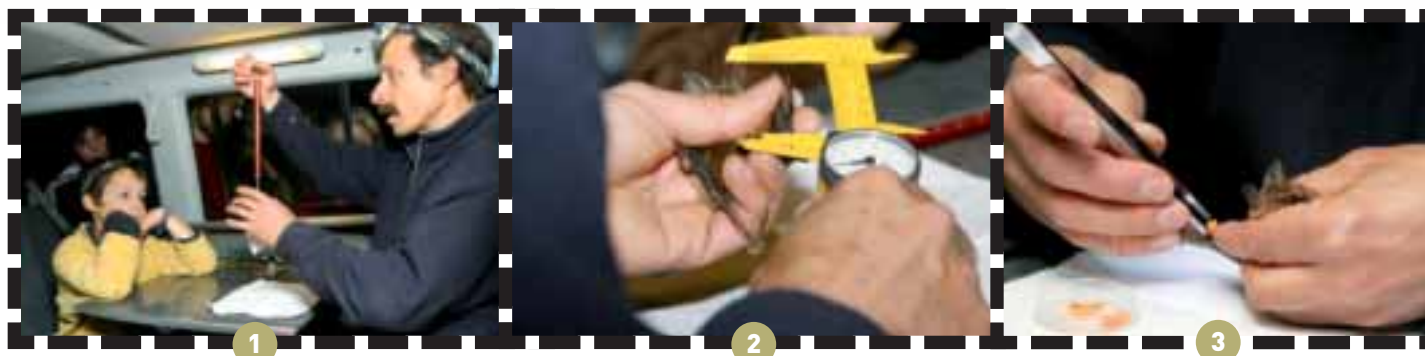
Une fois capturées à la sortie du gouffre, les trois chauves-souris sont amenées dans un véhicule aménagé où Michel Barataud va les peser (1), les mesurer (2), avant de les baguer (3) et de couper une touffe de poils sur la nuque (4) afin d'y coller un petit émetteur (5) qui permettra de les pister

Lampes sur le front, le petit groupe se prépare dès la nuit tombée pour la première phase de l'opération : tendre un filet japonais à la sortie du gouffre pour capturer au moins trois de ces petits mammifères, les marquer avec un émetteur et suivre leur parcours pour étudier leur territoire de chasse, inconnu jusqu'à maintenant.