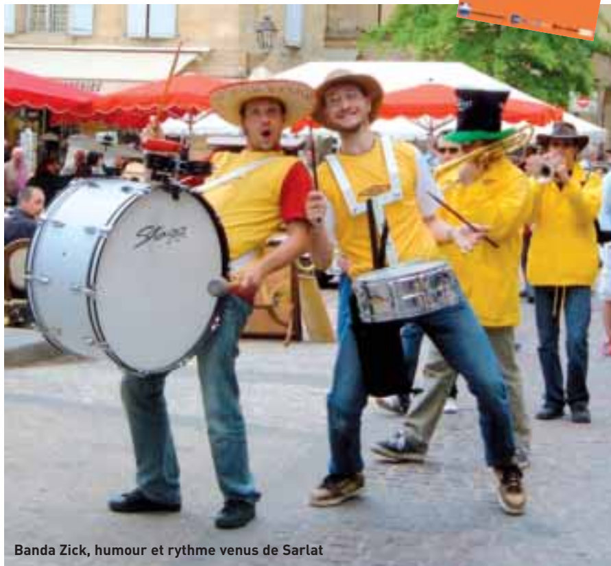
Banda Zick, humour et rythme venus de Sarlat