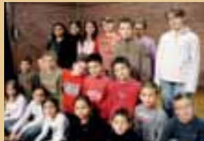
Des jeunes comédiens des ateliers théâtre de Dautry

« Tous en scène », au Centre Raoul Dautry. Rens. au 05.55.23.02.78. Les ateliers du Théâtre de la Grange, à la Grange de Rivet, du 4 au 13 juin. Rens. et réservations au 05.55.86.97.99