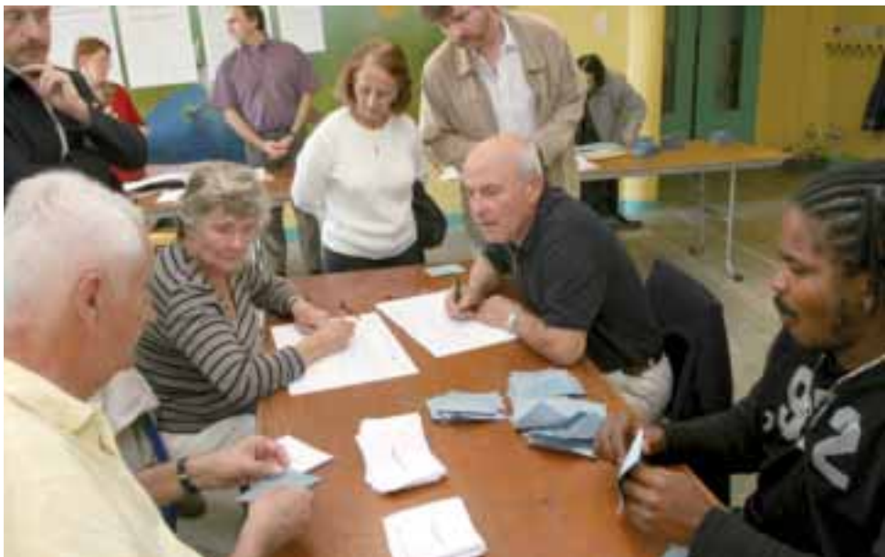
Le dépouillement est public et débute dès la fermeture du scrutin.

En mai, les électeurs ont élu le Président de la République pour les cinq années à venir. En juin, ils sont appelés aux urnes pour choisir les députés qui composeront la nouvelle Assemblée nationale et, l'an prochain, place aux élections municipales et cantonales. Petit rappel du processus de vote pour être fin prêt le jour J.