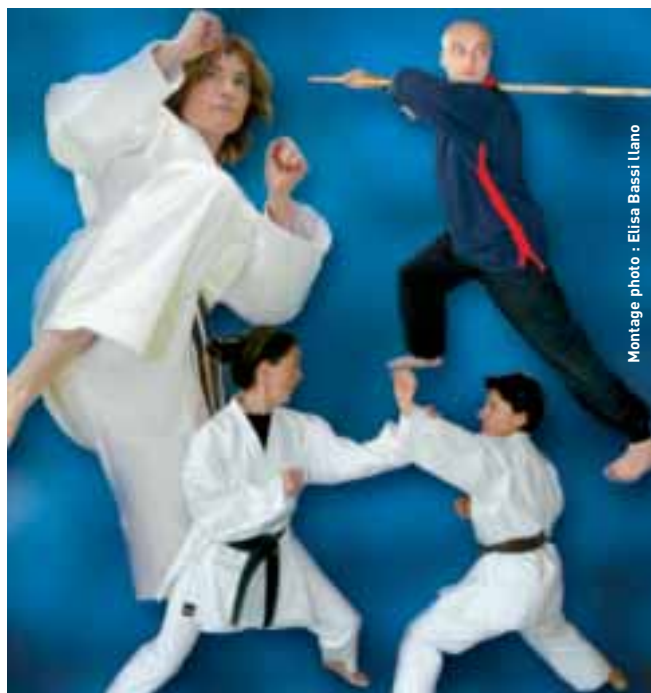
Montage photo : Elisa Bassi Ilano

Rens :mairie, direction des sports, 05.55.92.39.39.