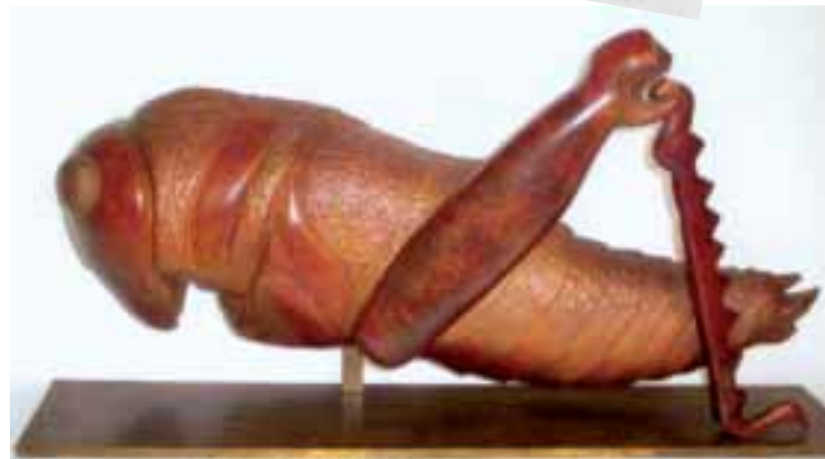
Criquet - Sculpture de François Chapelain-Midy