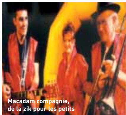
Macadam compagnie, de la zik pour les petits