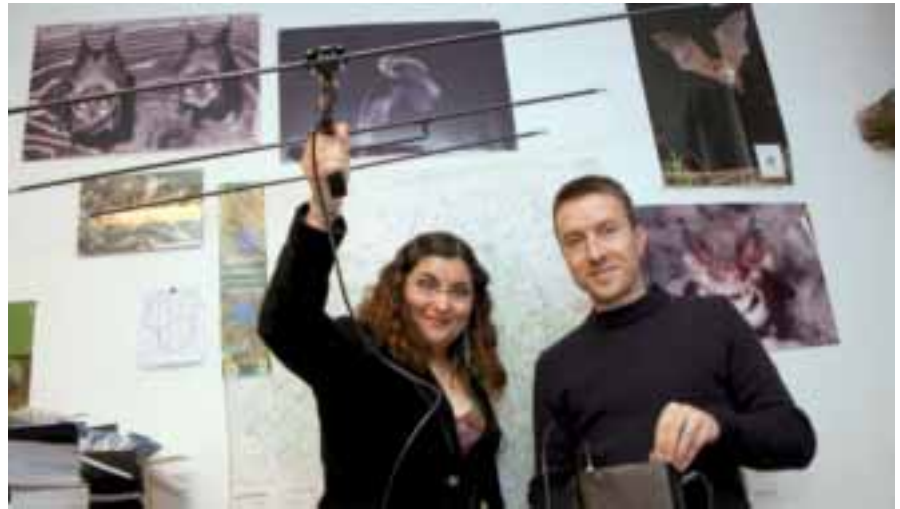
Les membres du GMHL étudient les mammifères, les reptiles et les amphibiens.

d'une grosse boîte d'allumettes environ 6 cm) mais qui atteint un format de feuille de papier (30 cm) lorsqu'elle déploie ses ailes.