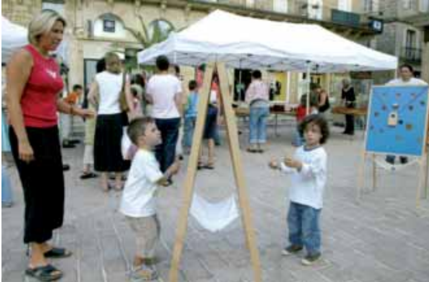
La fête du jeu en 2006, place du Civoire, organisée par la ludothèque qui fêtait ses vingt ans.

Cela se passe le 26 mai partout en France et cela s'appelle la Fête du jeu. A Brive, le service communal de la Petite enfance et la ludothèque se mettent en quatre pour faire de cette journée, la 9 e , un feu d'artifice ludique. Comme en 2006, la ludothèque s'expatrie pour le temps d'une journée place du Civoire, de 14h à 18h. Respectant la charte de la Fête du jeu, toutes les animations proposées aux enfants et aux plus grands - il n'y a pas d'âge pour s'amuser - seront bien évidemment gratuites. Jeux d'adresse, de stratégie, de créations, des jeux traditionnels ou surdimensionnés, il y en aura pour tous les goûts et toutes les aventures ludiques.