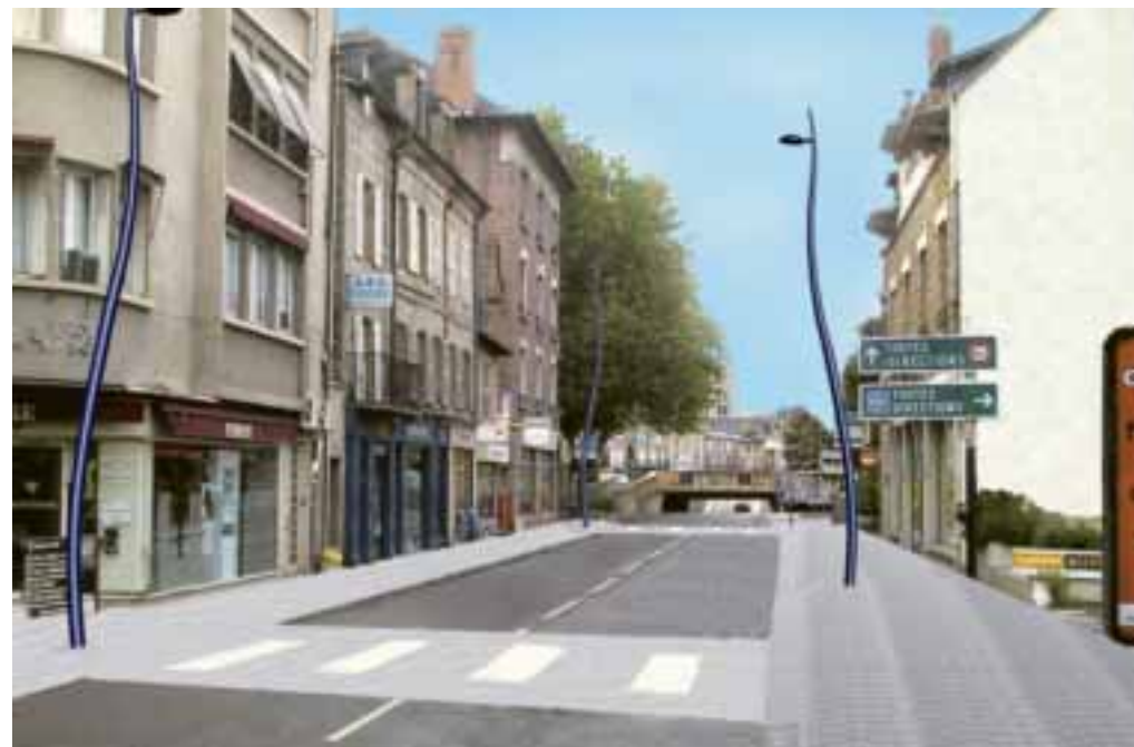
Perspective de la future avenue du 14 Juillet sans les mobiliers urbains délimitant l'espace piétons.

vont naturellement être mises en place avec les commerçants et les riverains.