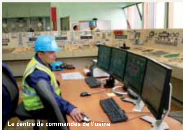
Le centre de commandes de l'usine

Cette nouvelle mise aux normes visait à respecter les objectifs fixés par l'arrêté du 20 septembre 2002 et devait être effective pour la fin 2005. A la une de l'arrêté, la réduction des émissions de gaz polluants, les rejets tolérés par l'arrêté de 1991 étant considérablement réduits et de nouveaux polluants tels que les dioxines sont désormais quantifiés et doivent respecter des valeurs maximales.