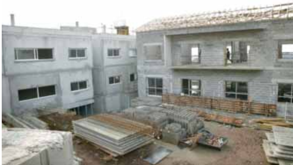
EHPAD de Chanoux : une gestion responsable