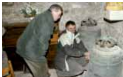
A la recherche d'indices sur la provenance des anciennes cloches de l'église.

Un bon campaniste se doit aussi d'avoir l'oreille fine afin de pouvoir accorder les cloches d'un carillon. Il est aussi charpentier quand il entretient ou installe le beffroi - dont les plans sont dessinés par ordinateur dans l'atelier de Noailles -, pose les jougs ou restaure les croisillons. Le campaniste de Noailles se transforme aussi aisément en spécialiste des mécanismes d'horlogerie. Reste le fonctionnement des cloches mêmes. Fini le temps du tout à la main ce qui incite désormais le campaniste à tout savoir de l'électronique et de l'élec-