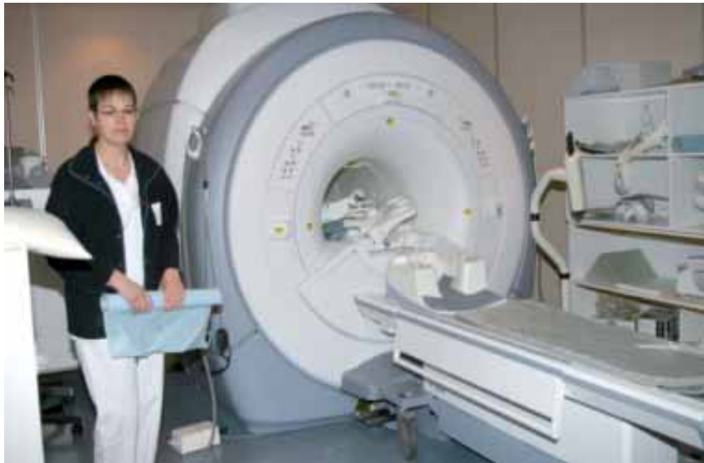
Baignant dans son champ magnétique, « le nouvel IRM travaille plus vite et avec une meilleure résolution ».

« Les besoins en IRM sont très importants. » Conséquence : un délai d'attente que le responsable qualifie « d'élevé, mais de l'ordre de la moyenne nationale ». Le souci reste de « diminuer au mieux les temps d'attente » pour les patients. Et ce d'autant que ce nouvel IRM, comme son prédécesseur, est à la disposition, dans le cadre de la coopération interhospitalière, du public comme du privé, pour les patients de Brive, Tulle et Ussel. « L'objectif serait d'installer un IRM entre Tulle et