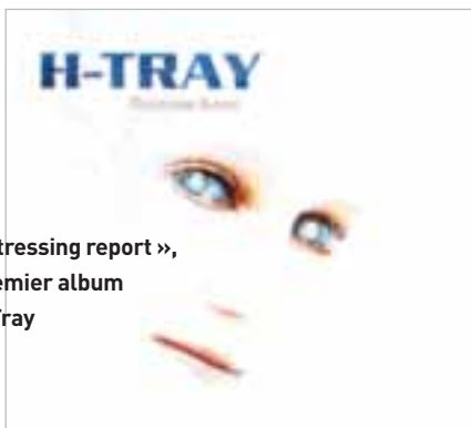
« Distressing report », le premier album d'H-Tray

Suit une présélection régionale sur écoute. Un jury composé de professionnels de la musique choisit parmi la totalité des candi-