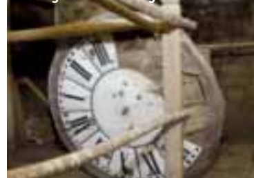
Vestige d'une horloge d'autrefois