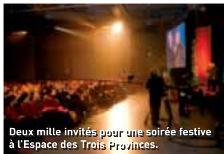
Deux mille invités pour une soirée festive à l'Espace des Trois Provinces.

* Cantal, Puy-de-Dôme, Allier, Corrèze et Creuse.