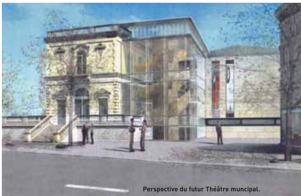
Perspective du futur Théâtre municipal.