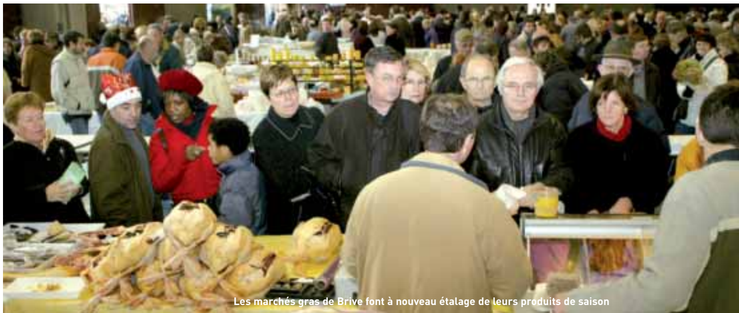
Les marchés gras de Brive font à nouveau étalage de leurs produits de saison

De décembre à mars, c'est la pleine saison des foies, magrets et autres produits gras d'oie ou de canard... Des marchés que l'on nous envie, paraît-il, même en Périgord. Cette année, les foires grasses seront cinq, avec une nouvelle venue : une foire primée aux chapons le 16 décembre salle Brassens.