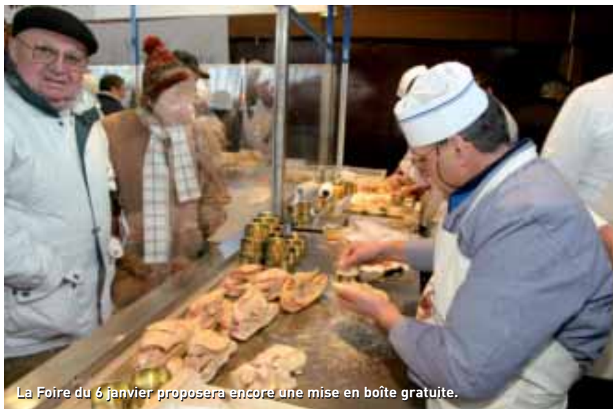
La Foire du 6 janvier proposera encore une mise en boîte gratuite.

C'est aussi ce même dynamisme qui a présidé l'apparition, il y a deux ans, d'une quatrième foire grasse en mars, rallongeant ainsi la saison. Toujours pour suivre