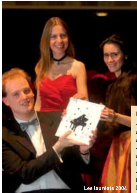
Les lauréats 2004