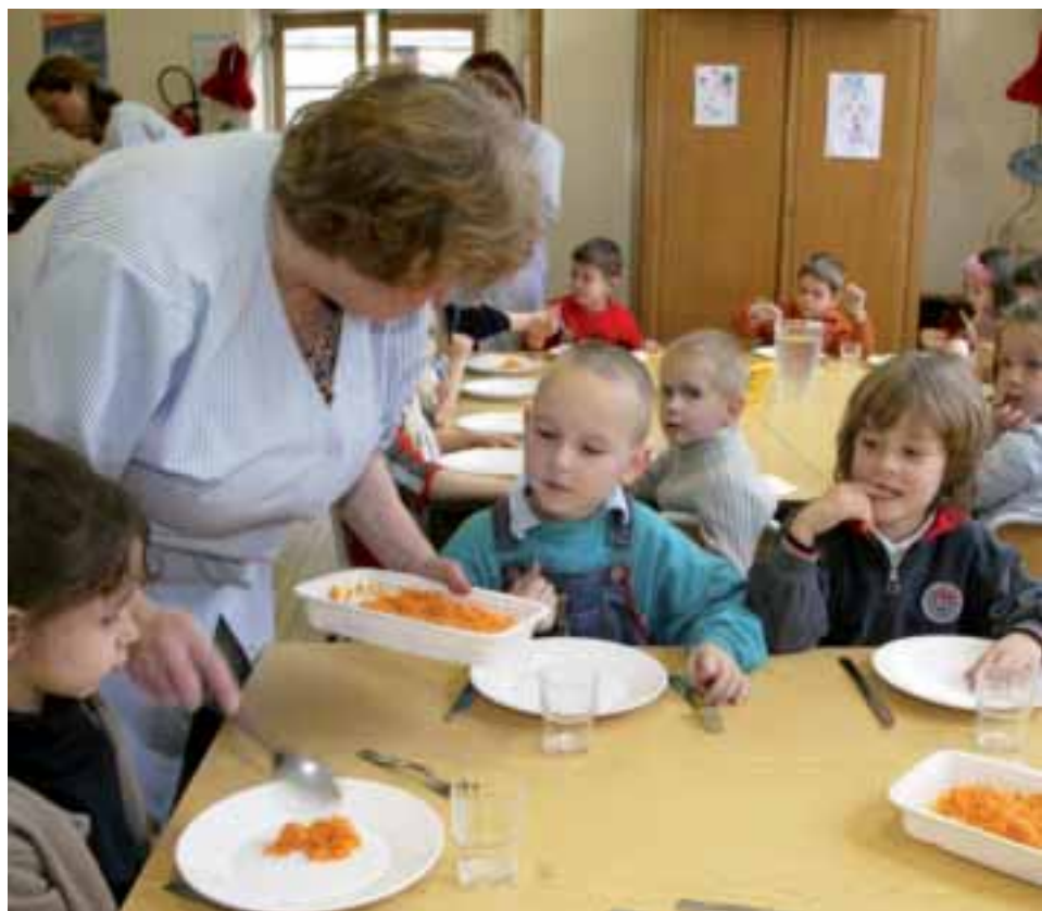
Dans son rapport sur la gestion de la Ville de Brive, la Chambre régionale des comptes a noté la qualité de l'accueil et des activités périscolaires dans le domaine de la petite enfance.

Cette augmentation résulte d'éléments imposés à la collectivité : l'application des 35 heures depuis le 1 er janvier 2002, l'évolution de l'indice de la fonction publique (entre 0,5% et 1,8% par an). Il est à noter que le taux d'absentéisme est