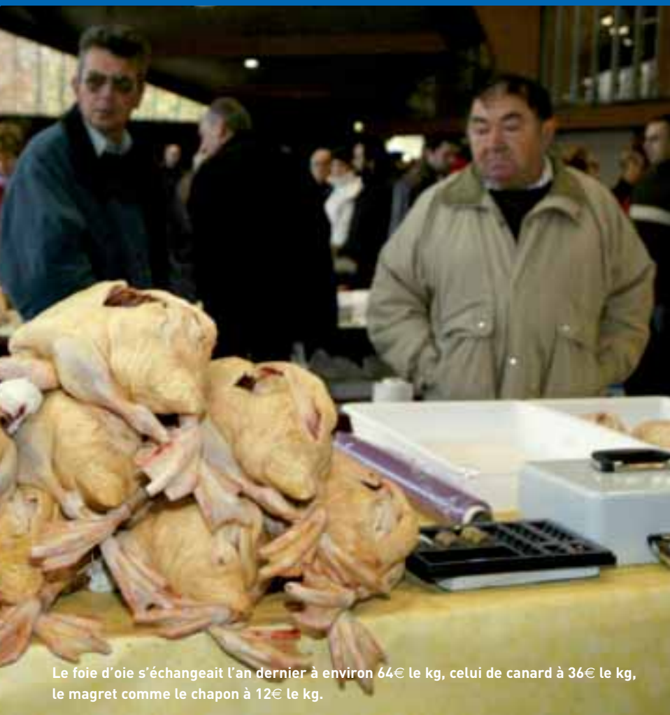
Le foie d'oie s'échangeait l'an dernier à environ 64€ le kg, celui de canard à 36€ le kg, le magret comme le chapon à 12€ le kg.

la demande des consommateurs, la Ville de Brive crée cette année une cinquième foire grasse, primée aux chapons, qui s'intercale le 16 décembre. « Nous y pensions depuis plusieurs années. Si on a passé une grande mode avec l'oie ou la dinde à rôtir à Noël, le chapon prend aujourd'hui de plus en plus de place sur les tables des réveillons. C'est moins gros et la viande est moelleuse, plus en accord avec les goûts actuels. » La dizaine de producteurs locaux de chapons vont donc concourir, salle Brassens.