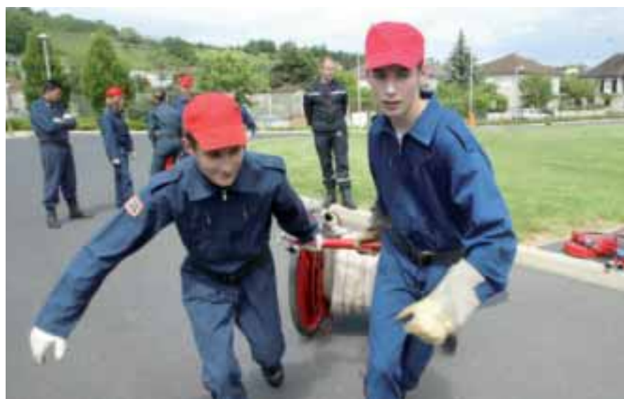
A la différence des autres sections scolaires, les jeunes sapeurs pompiers du collège Jean Moulin continueront à participer aux cérémonies commémoratives.