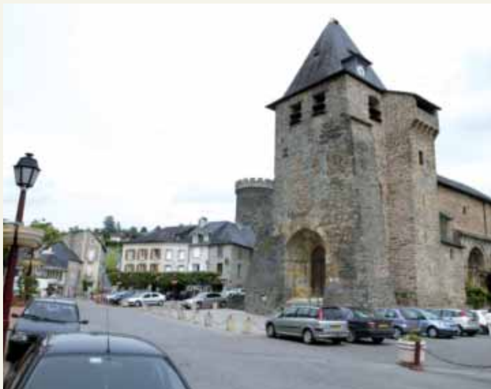
L'ardoise... cette matière grise qui domine et accentue les humeurs du ciel.

L'ardoise... Au début du 19 e siècle, son exploitation assura une étonnante prospérité à la commune. L'industrie des ardoisières employait jusqu'à 400 ouvriers. Ici, pas de pans de faille comme à Travassac, mais des puits maçonnés appartenant à des petits propriétaires qui parallèlement cultivaient la vigne sur les coteaux. Du vin consommé d'ailleurs par les ardoisiers. « Il y avait des marchands de vin en