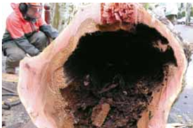
Plantés vers le milieu du 19 e siècle, certains de nos platanes arrivent en fin de cycle de vie : système racinaire absent, troncs creux...

l'habitude de le voir, mais on ne le regarde pas vivre. Or, on a tendance à l'oublier, l'arbre est un être vivant comme les autres : il naît, vit, vieillit et meurt. Il a un cycle de vie et doit s'adapter aux nombreux facteurs écologiques (climatiques, atmosphériques ou biologiques) du milieu dans lequel il vit. Et, comme la ville n'est pas un milieu naturel pour lui, les étapes de sa vie sont différentes et demandent une attention particulière de la part de l'homme.