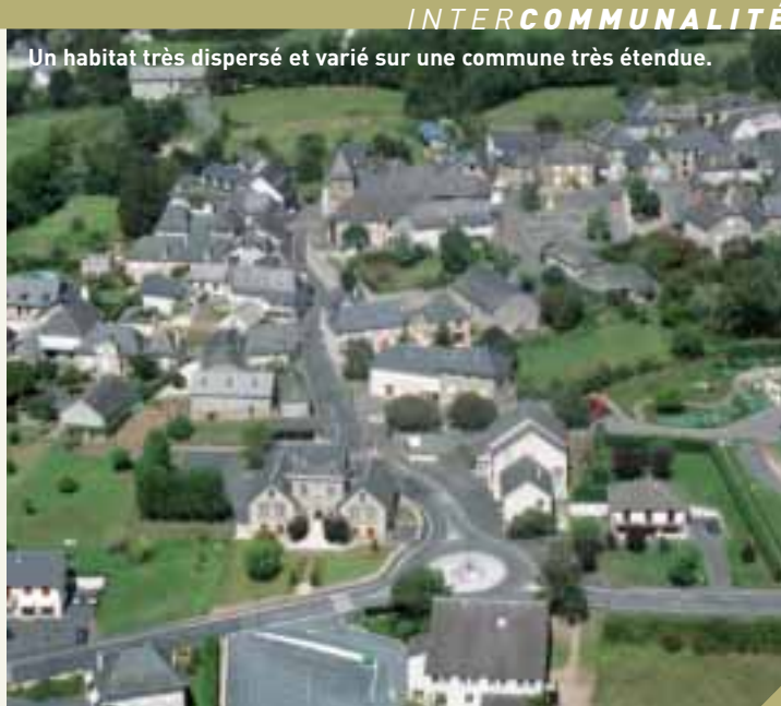
Un habitat très dispersé et varié sur une commune très étendue.

vrai restaurant scolaire, avec de la vraie purée », relève Gilbert Rouhaud. La commune ne manque pas de projets pour améliorer le cadre de vie de ses habitants : agrandissement de la salle polyvalente « qui tourne déjà à plein régime tous les week-ends », aménagement d'une maison en salle d'exposition et point lecture « avant d'envisager une bibliothèque », l'éclairage du parcours de santé... Un bien vivre, une qualité de vie qui passe aussi par la reconquête des chemins pédestres offrant de belles promenades. « Se sentir bien » est le leitmotiv de ce maire qui revendique fièrement ses racines. Avec un souci toutefois : « ne pas augmenter les impôts ». Pari encore tenu cette année. ● M.C.Malsoutte