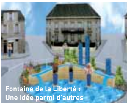
Fontaine de la Liberté : Une idée parmi d'autres

Bernard Murat rappelait ensuite deux dossiers de rénovation urbaine : les Chapélies et Tujac. Le projet de rénovation des 176 logements des Chapélies a été inscrit à l'ANRU suite à son intervention au Sénat et auprès du Ministre du logement. Un dossier d'argumentation sera transmis au préfet mi-avril alors qu'une réunion, programmée fin avril, permettra de présenter aux partenaires de l'ANRU l'opération qui concerne ces 176 logements.