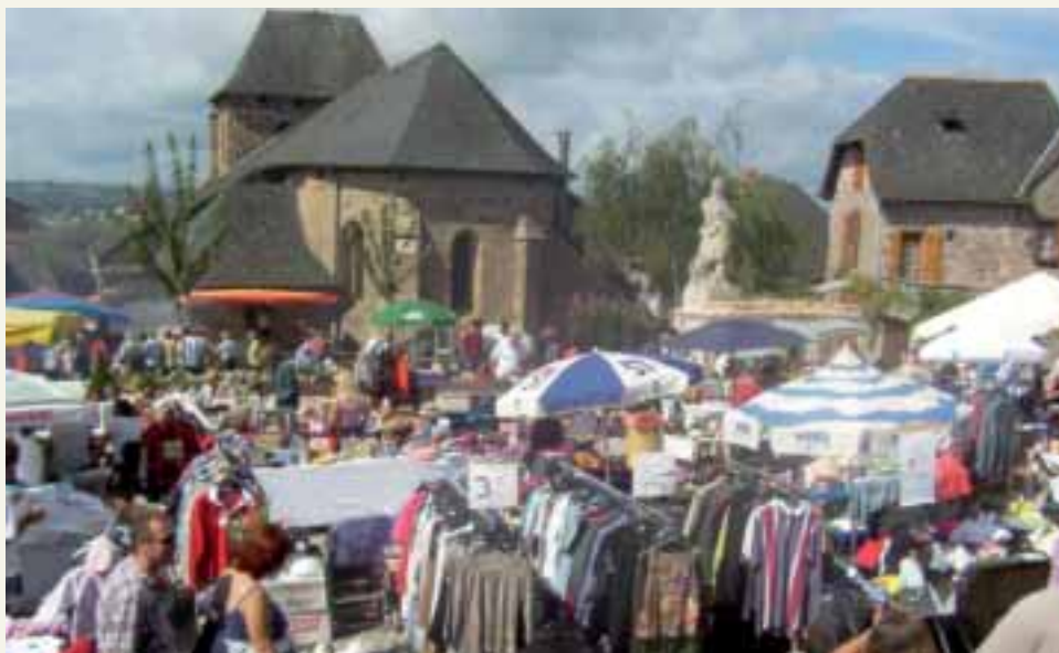
Le deuxième dimanche de septembre, un gros vide grenier brocante squatte les rues du bourg réaménagé.

Ces dernières années, la donne a changé. Déjà traversée par l'A20, Ussac a connu de grandes mutations avec l'arrivée d'infrastructures routières : la D901, l'A89 et