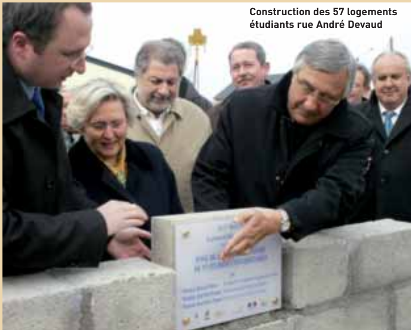
Construction des 57 logements étudiants rue André Devaud

Le lancement des travaux de construction de 57 nouveaux studios pour les étudiants affirme la vocation universitaire de Brive. Si la fin des travaux est prévue pour la prochaine rentrée, en septembre 2006, le prochain gros chantier est celui de la construction d'un site qui regroupera le centre juridique, des locaux supplémentaires pour le STAPS, des deux départements d'IUT, une bibliothèque, un amphithéâtre et des locaux de recherche pour l'IRCOM. D'ores et déjà, la Ville a fait l'acquisition des terrains pour un montant de 725.024,36 euros. Le 2 février dernier, le maire de Brive a adressé une lettre au ministre de l'Education, M. de Robien, afin de demander le déblocage des crédits prévus pour la construction de ce site. Les travaux devraient débuter en juin 2007 et le site opérationnel pour la rentrée 2008.