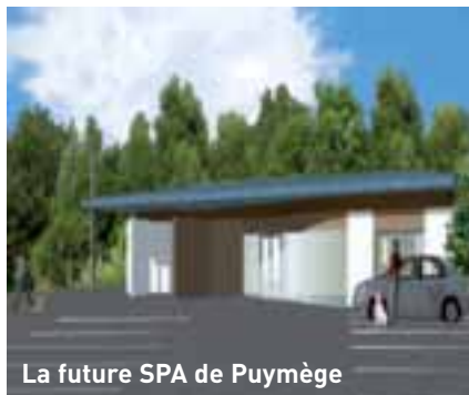
La future SPA de Puymège

Les services de la Ville travaillent actuellement à la conception d'une nouvelle salle qui viendrait en complément de l'Espace des Trois Provinces. Prévu pour être implanté à l'ouest de Brive, près du futur stade nautique et de l'usine Deshors, ce nouvel espace baptisé « Marc Chadourne » du nom de l'écrivain briviste, devrait ouvrir ses portes en juin 2008.