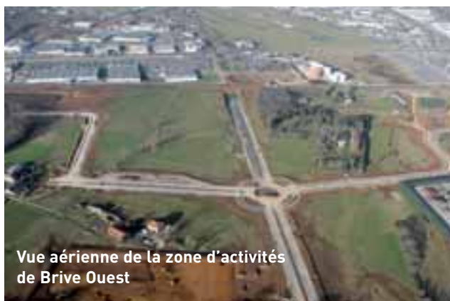
Vue aérienne de la zone d'activités de Brive Ouest

Pour accueillir les investisseurs et permettre aux entreprises existantes de se développer, 200 hectares seront aménagés sur le territoire de la Commu-