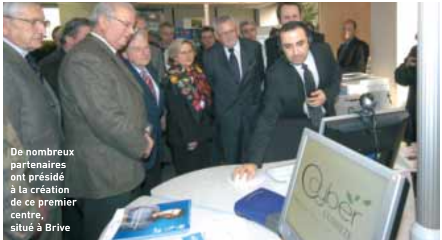
De nombreux partenaires ont présidé à la création de ce premier centre, situé à Brive