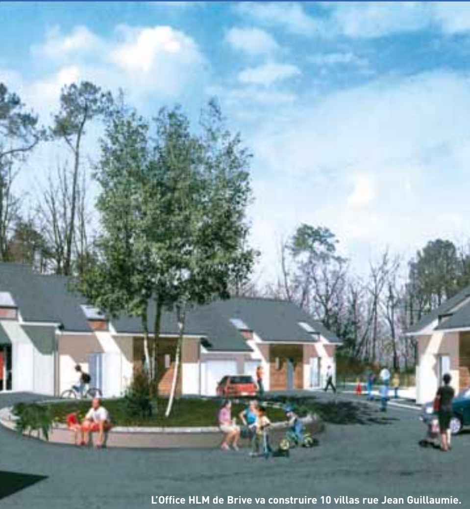
L'Office HLM de Brive va construire 10 villas rue Jean Guillaumie.

Parallèlement, le plan de cohésion sociale présenté en 2004 par le ministre Jean-Louis Borloo a fixé à tous les organismes HLM des objectifs de production de logements sociaux clairs et précis. Sur ce point, Jean-Pierre Tronche notait que si l'Office de Brive a reçu pour mission de construire 540 logements sur la période 2005-2009, il a choisi d'aller bien au-delà en engageant la construction de 581 logements sur la période 2005-2007.